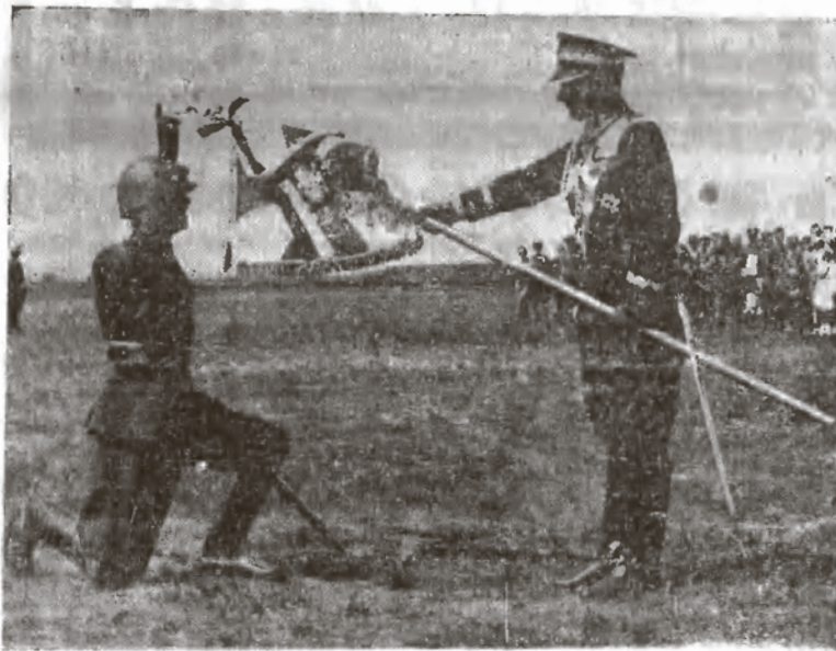
Naczelnego Wodza przekazuje sztandar z rąk społeczeństwa w twarde ręce żołnierskie (Moment z uroczystości niedzielnych na 10 tniuku toruńskim)