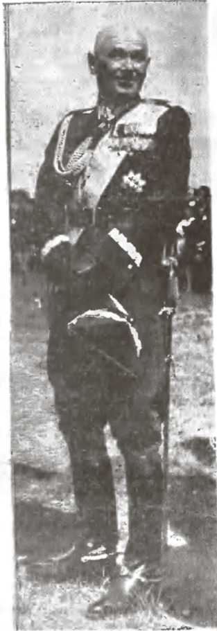
Bliski, serdeczny i swój — takim Go zapamiętamy

Scenarja na placu Rewii na błoniach nadwiślańskich za parkiem toruńskim była w dniu wczorajszym nieco inna jak w niedzielę. Błękit nieba powlekły strzępy obłoków, gwałtowne powroty wiatru niesły tumany piasku, a dzieci, które