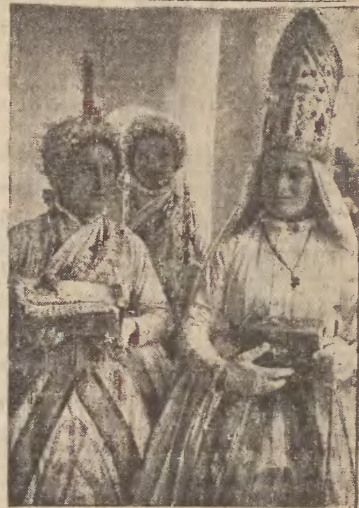
Malownicze stroje ludowe dziewcząt węgierskich na święta Bożego Narodzenia.