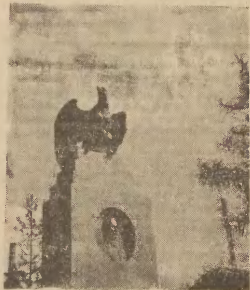
Szczył pomnika Romualda Traugutta.

Szóstego dnia nad ranem ujrzałem okręt. Halucynacja? Nie, to była rzeczywistość. Ale okręt oddalił się. A więc koniec? Byliśmy już u kresu sił. Zemdlałem. Ocknałem się raz. Wtem okrzyk: okręt! Okręt! Z norweskiego statku „Belmoira” wysłano łódź, która zabrała nas na zbaw- ny nokiel.”