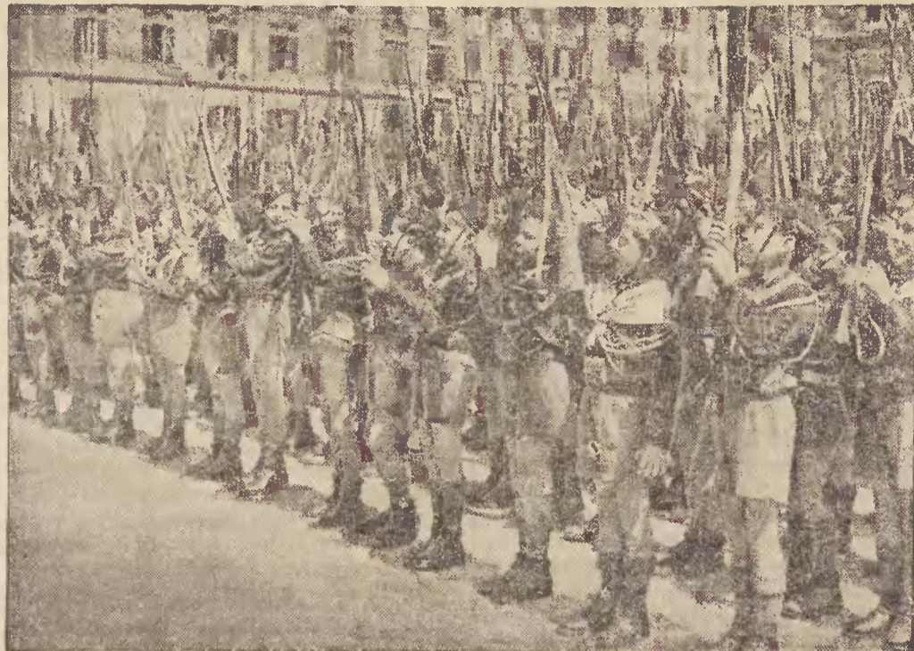
W dniu 21 bm. stolica Imperium włoskiego przeżywała 2692 rocznicę swego istnienia. Chłopcy, zrzeszeni w faszystowskiej Ballili, uświetnili ten dzień defiladą przed Mussolinim