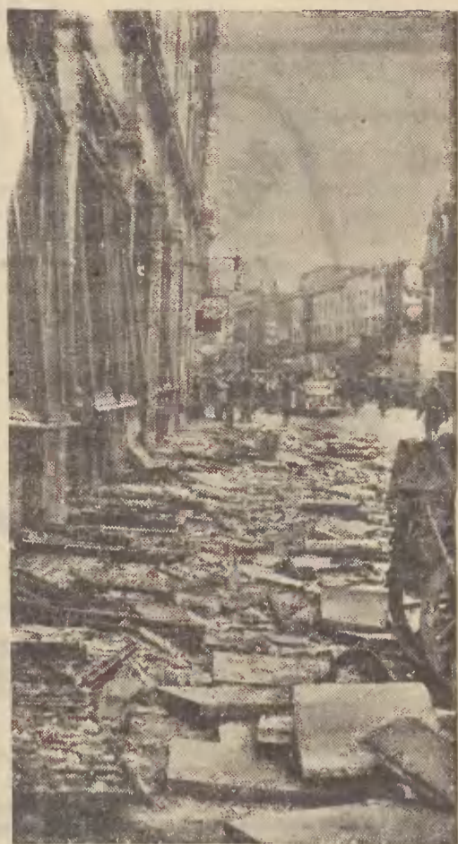
Od dłuższego już czasu Londyn żyje pod wrażeniem częstych wybuchów bomb, czy to w śródmieściu, czy na przedmieściach stolicy. Oto widok ulicy i domów na przedmieściu Cadby Hall, gdzie wydarzyły się ostatnie eksplozje.