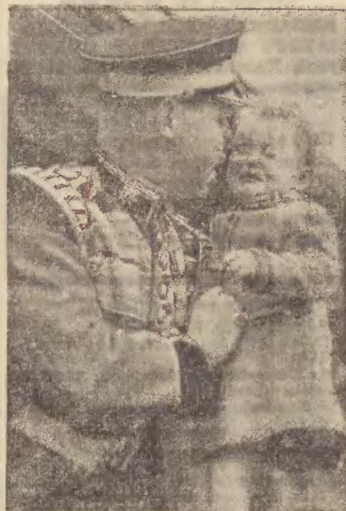
Na jednym z dworców londyńskich, aparat foto-reportera uchwycił scenę pożegnania ojca z rozpaczającym synkiem. Ojciec jest członkiem orkiestry gwardzystów angielskich i razem z całym zespołem wyjeżdża do Ameryki na tournée koncertowe.