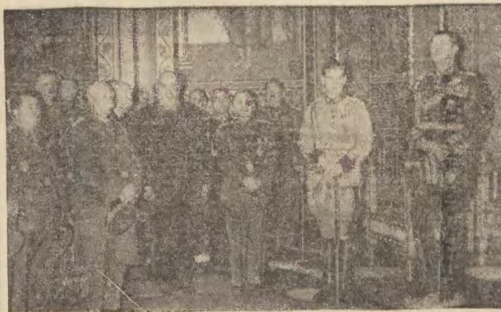
Cała Rumunia obchodziła w ostatnich dniach uroczystości 100-ną rocznicę urodzin swego pierwszego króla, Karola I. Na reprodukcji — król Karol II, wielki wojewoda Michał i członkowie rządu składają hołd zmarłemu monarsze w mauzoleum królewskim.