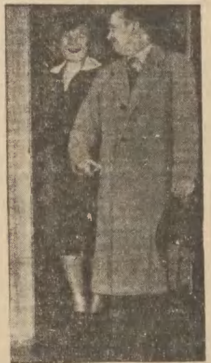
Małżonka amerykańskiego komika Stana Laurela została skazana na 24 godzinny aresztu za zbyt szybką jazdę samochodem. Po odcierpieniu kary, gdy mąż przybył aby ją odebrać z rąk dozorców więzienia, cofnęła wniesioną poprzednio skargę o rozwód.