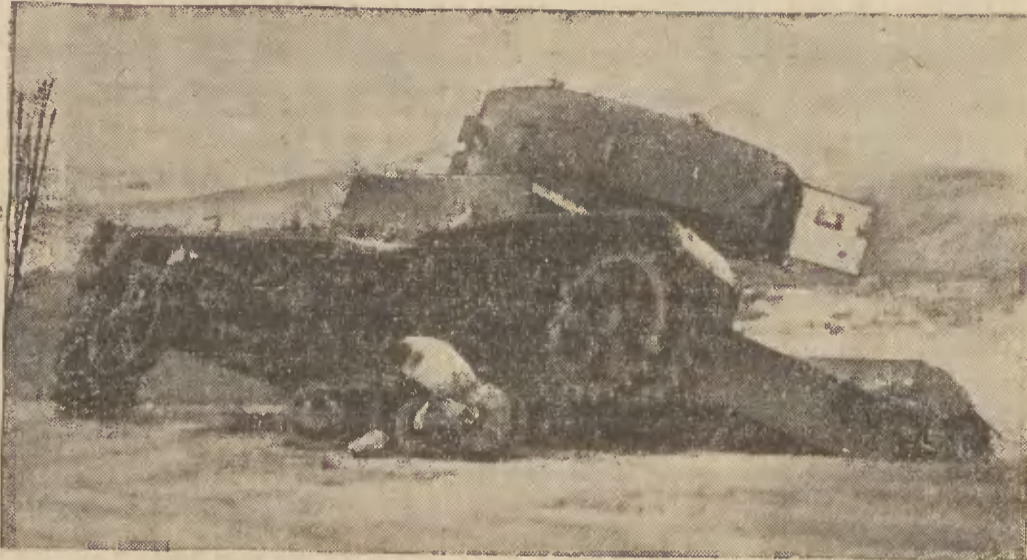
Na szosie z Leridy do Barcelony oddziały gen. Franco wzięły do niewoli sowiecki czołg.

przy tak intensywnym tempie zbrojeń nie udało się uniknąć, mimo że drogą raz po raz emitowanych pożyczek wewnętrznych wyciśnięto ze społeczeństwa wszelkie kapitały, jakie tylko można było uruchomić. W tym roku operacje kredytowe, wobec wysuszenia rynku, będą oczywiście o wiele trudniejsze. Pozostanie więc droga operacji walutowych. Zmiana Schachta — Funk jest pod tym względem położeniem kropki nad i.”