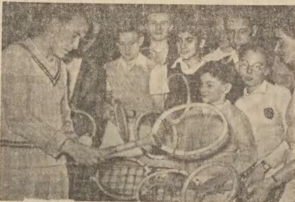
Znany francuski „muszkieter” tenisowy trenuje obecnie węgierską reprezentację tenisową, która walczyć będzie o puchar Davisa.

Zawodom przyglądało się około 30 tys. widzów. Gra toczyła się na ciężkim boisku.