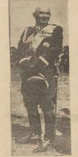
Bliski, wierzchny i swój — takim Go zapamiętamy

Teraz Pan Marszałek, nie zwalając na tłumy publiczności, odebrał całą ogólną pole i osobliwie dziękował ofcom, przedstawicielom społeczeństwa miast i powiatów pomorskich, które wczoraj przekazały Armii ufundowany brzo.