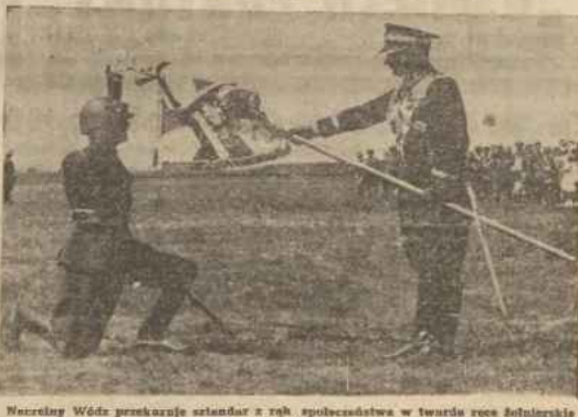
Naczelny Wódz przekazuje sztandar z rąk społeczeństwa w twarde ręce żołnierskie (Młodzi z uroczystości historycznych na to tnakru toruński)