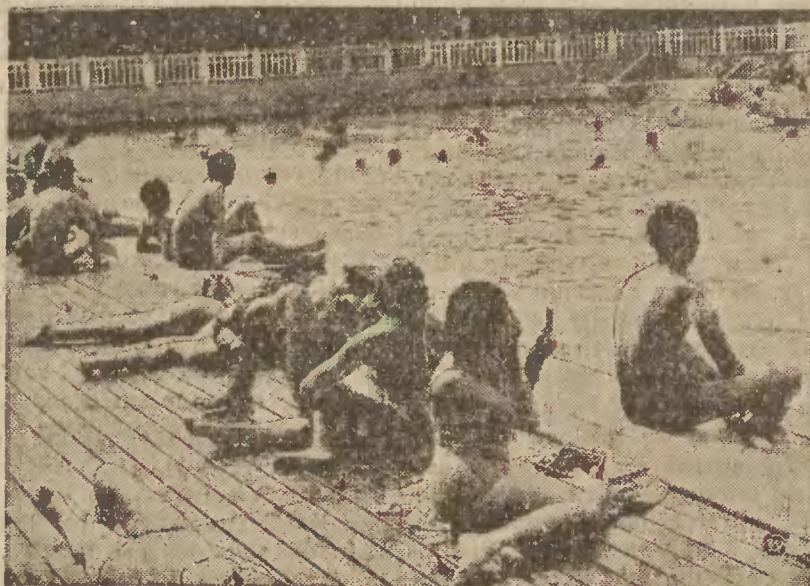
Z powodu upałów, które zapanowały w ostatnich dniach również w Paryżu, szczególnie powódzenie miały plaże paryskie, na które podążał dla ochłodzenia się, każdy kto tylko mógł.

Powrót z Gdyni do Gdańska nastąpił w godzinach wieczornych. W międzyczasie zwiedzono miasto i port, jak również wzięto udział w zabawie tanecznej w sali restauracji Wystaw i Targów.