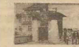
1) Stacja mareograficzna Instytutu Hydrograficznego. 2) Wnętrze stacji — w głębi przyrządy do automatycznego notowania poziomu wody.

Mareograf jest kompletno przyrząd do mierzenia kubitawowego poziomu wody w morzu przy bezrach polskich. Posiadam ten w załadunku od warunków atmosferycznych i innych wpływów podlega duży wsił, Białoski, których rozpiętość czasami przekracza wysokość jednego metra.