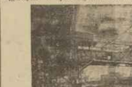
Talmonowie do przeladunku węgla w porcie gdańskim.

panstwach donal znacznych przewoźnic na krajach Polski. W r. 1929 Anglia eksportowała ok. 6.437.000 t. Polska ok. 5.410 tys. ton, w 1936, wobec zmniejszonego zapotrzebowania, import krajów Skandynawskich maleje, lecz spadek polskiego eksportu węgla, wynoszącego 4.856.000 t., jest o połowę mniejszy, niż spadek eksportu angielskiego, którego wywoz 5.253.000 t. W roku 1937-ym wywóz węgla z Polski wzrasta do 6.883.000 t., a wywóz węgla angielskiego