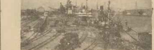
Ruch na nabrzeżu portowym w Gdańsku.

Wówczas kopalnie polskie w obramie przed tym zawieszony węgla angielskiego, ustanowiły podwyższenie taryfy przewoźnej, przez co zmniejszyło przenikanie węgla angielskiego z Gdańska do kraju. Tymczasem kopalnie obywateli by to obronienie stawki kolejowej z Ząbków do Gdańska. Mimo to jednak ciężka tona węgla polskiego z Gdańska kosztowała 45,30 zł, wobec 31 zł, planu, za tona węgla angielskiego. Sprawa skłoniła się w grudniu 1933 r. zawieszono umowy węglowej między Polską i Szwecją, wedle której kole-