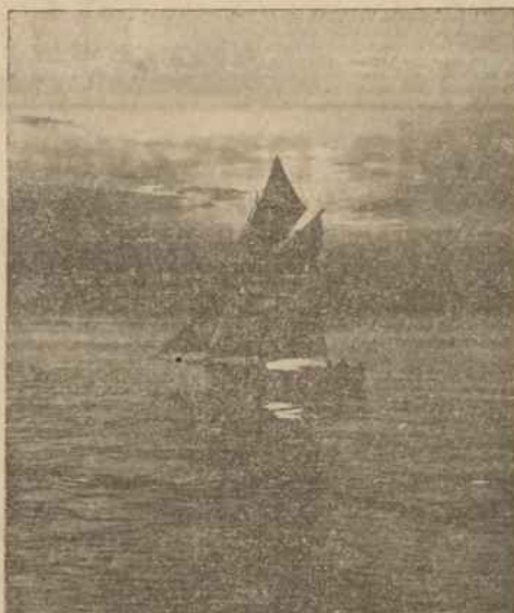
Romantyka polskiego morza

Morzu temu — Polskietmu Morzu — znnowu oddano hold w jutrzejsze, jemu poświęcone święto. Jak przed pięciu laty uroczysty dzień uświetlił Majestat Rzeczypospolitej w media Pierwszego Jej Obywatela, i jak wówczas nieoprelcanna rzecze ludzkie skupia się u stóp otwartą, aby modlić się o dalszą łaskę Bożą dla ispo wspaniałego dzieła rąk i mózgów polskich. Zaś modły te będą radośnie, połączone z gorczym dziękczynieniem za to, co Opatrzność w bezmiennej Swojej szczerobliwosci już dziś dał nam zechciała. W. M.