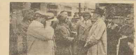
Z przybytu wiewiórek m. m. Barankiewicz (1) na Bielu. Bielo w grupie monumentalnej z Wiewiórką m. m. Barankiewicz (2), kuzynkę Replibel w Gdyni m. m. Sokół (3) i przez Jacka Froma, Replibel w Gdyni (4).