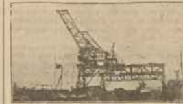
Prace w porcie gdańskim.

Na to powodzenie radkowiec nieuchronnie wywołują a niezmądnionym warunków i sytuacji w jakiej port nasz pracuje.