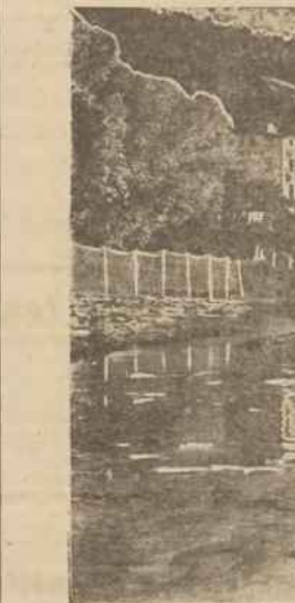
Widok agliny Orlowa.

Zaoczerednio 50 gr. na kąpiel morską samu w sobie modyby jeszcze nie było dostateczną zarządzi do wyjazdu na teren sopocki, bo i przed latami kosztuje (jakkolwiek tygodniowy bilet kolejowy otrzymuje się za prozno).