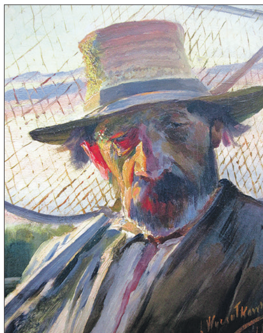
Leon Wyczółkowski, Rybak z siecią

stów mniej znanych stanowią o narodowym charakterze zbioru, ale i one w znakomity sposób podkreślają patriotyczny wysiłek wielu prawdziwych pokoleń kolekcjonerów sztuki przekazujących swoje zbiory na rzecz galerii. Przy tego rodzaju autorskiej koncepcji wystawy i w pewnym sensie bardzo subiektywnym wyborze prac zawsze można zgłaszać uwagi, ale sama kompozycja