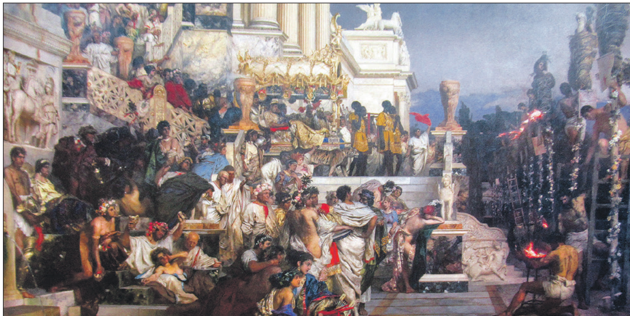
Henryk Siemiradzki, Pochodnie Nerona

Pierwszym dyrektorem instytucji został znany malarz Władysław Łuszczkiewicz, historyk sztuki, pedagog. Już po otwarciu zbiory bardzo szybko wzbogaciły się o obrazy ówczesnych znakomitości polskiego malarstwa - Jana Matejki, Piotra Michałowskiego, Henryka Rodakowskiego, Aleksandra Gierymskiego, Jacka Malczewskiego, Józefa Chełmońskiego. Liczni darczyńcy na przestrzeni lat wzbogacali kolekcję. W okresie międzywojennym galeria zmieniła nieco swój charakter i prezentowano polską sztukę