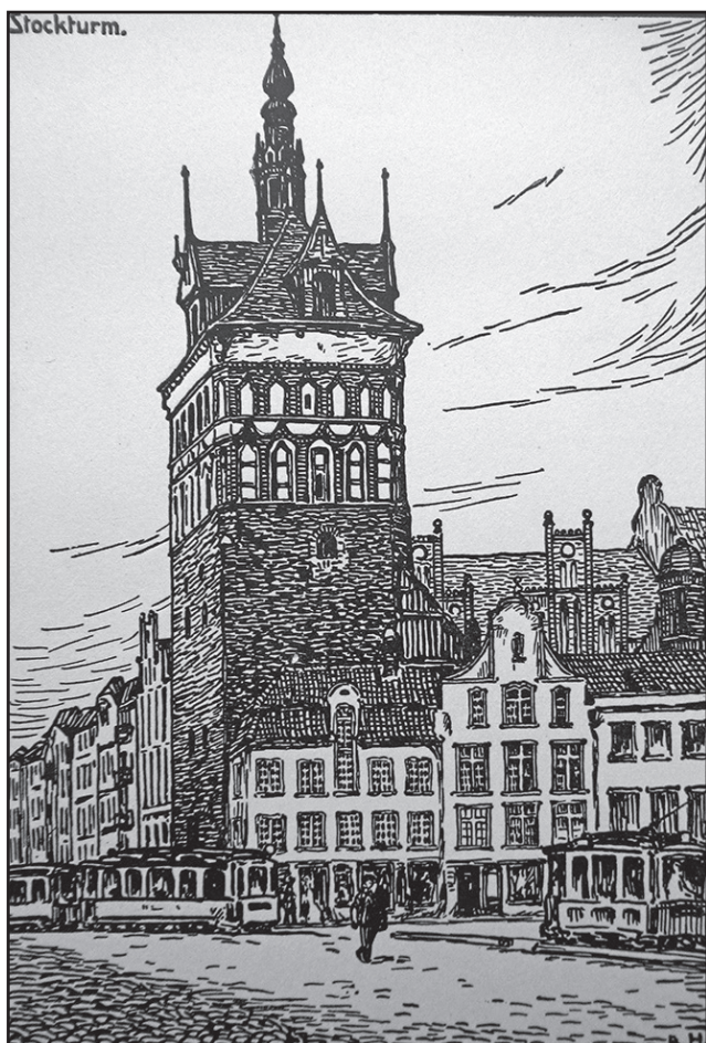
Berthold Hellingrath, Wieża więzienna, litografia