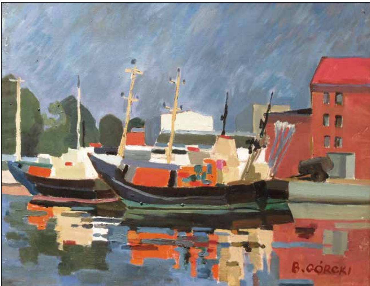
Bogusław Górecki, Hel, olej, płótno