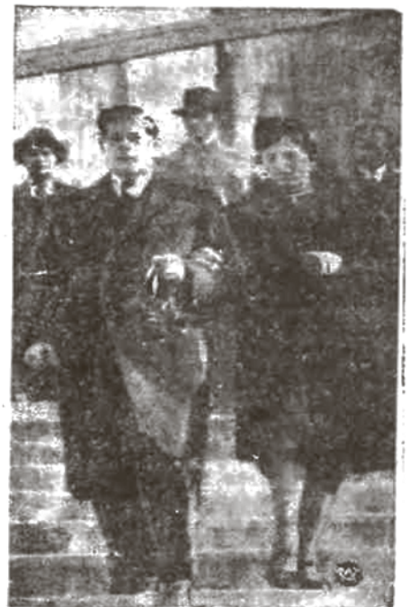
Na zdjęciu naszym rumuński następca tronu ks. Michał z wiedz w towarzystwie swej matki księżnej Heleny rumuńskiej Akropol w Atenach.