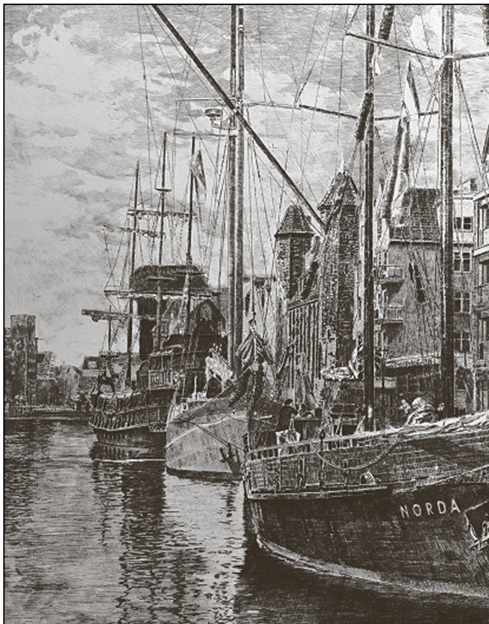
Wojtek Górecki, Żaglowce na Motławie, 2015, akwaforta